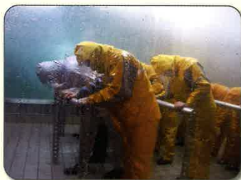
風速30mを体験しました