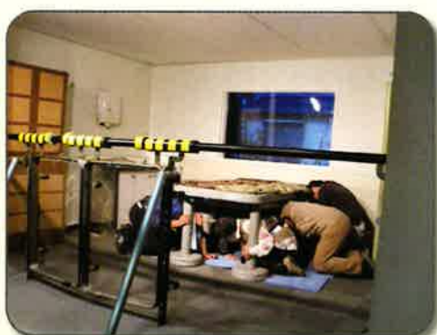
震度7立っていることができません